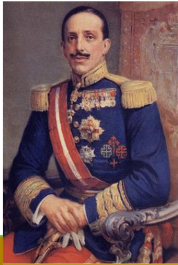
Reinado de Alfonso XIII. (1902- 1931)