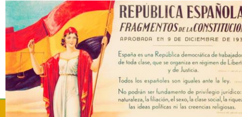
La Segunda República (1931-1936)