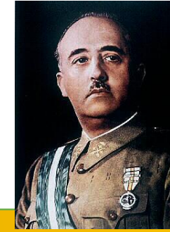
La Guerra Civil y la dictadura (1936-1975)