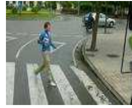
El paso de cebra