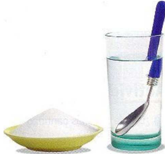
Agua con azúcar