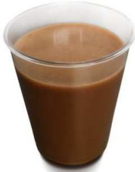
Batido de chocolate