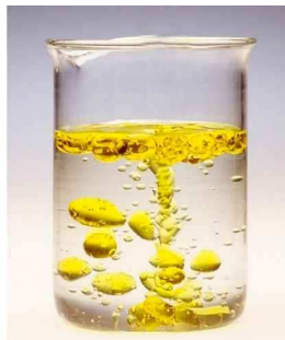
Agua con aceite