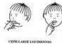
COTILLARSE LAS DIENTES