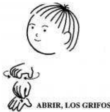
ABRIR, LOS GRIFOS