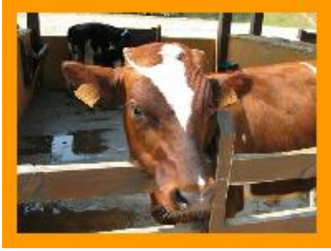
la vaca hace