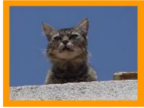
el gato hace